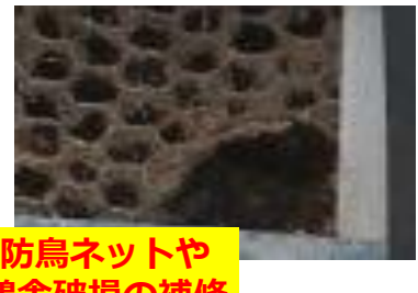
防鳥ネットや鶏舎破損の補修