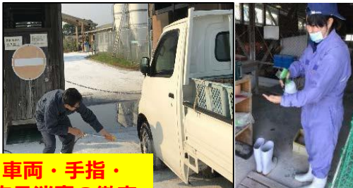
車両・手指・物品消毒の徹底