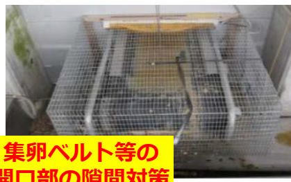
集卵ベルト等の開口部の隙間対策