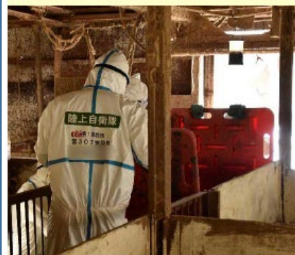
豚の追い込み作業を行う隊員